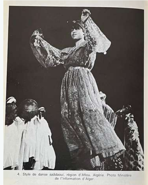
4. Style de danse saâdaoui, région d'Alger.

Les danses traditionnelles d'Afrique du Nord, du Maroc à l'Égypte, sont encore dansées aujourd'hui au cours des célébrations qui rythment la vie : les récoltes, les mariages, les baptêmes. Expressions festives traditionnelles, rurales ou citadines, rituels collectifs, agraires ou guerriers, phénomènes religieux, trances de possession ou thérapeutiques elles expriment la relation des gens à leur environnement, au rythme et à la musique et la cohésion au sein du groupe. Elles illustrent aussi la diversité et la richesse du patrimoine dansé qui traverse ces régions. En effet, chaque région se distingue par la richesse de ses costumes (broderies, bijoux, tatouages), nuances rythmiques, même si on retrouve un fond commun d'Est en Ouest et du Nord au Sud.