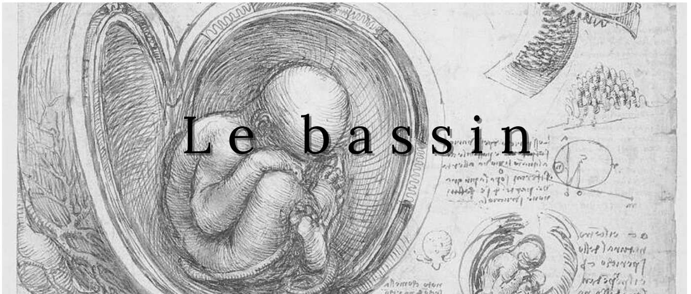
Léonard de Vinci