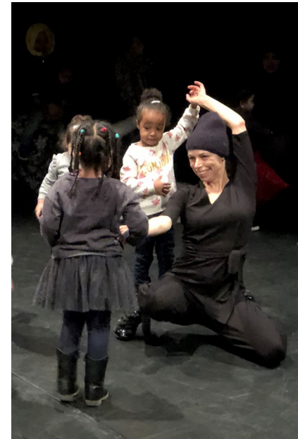
Etapes de création – Répétitions publiques.