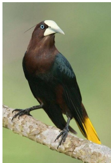
Cassique à crête