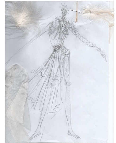
Croquis Costume « Petit Homme » Céline Haudebourg