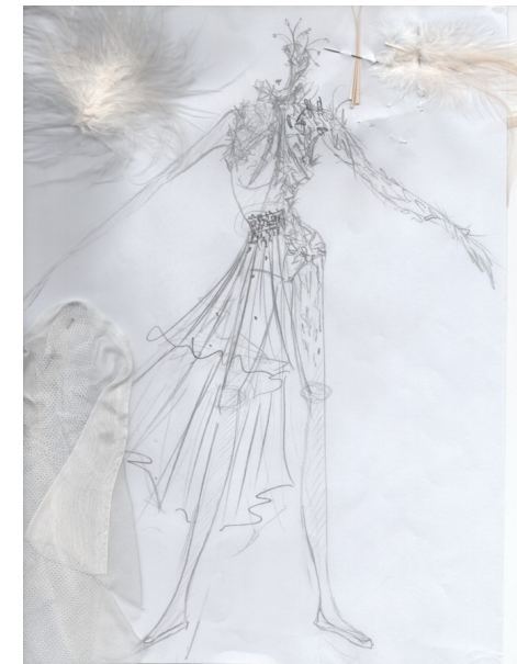
Croquis Costume « Petit Homme » Céline Haudebourg